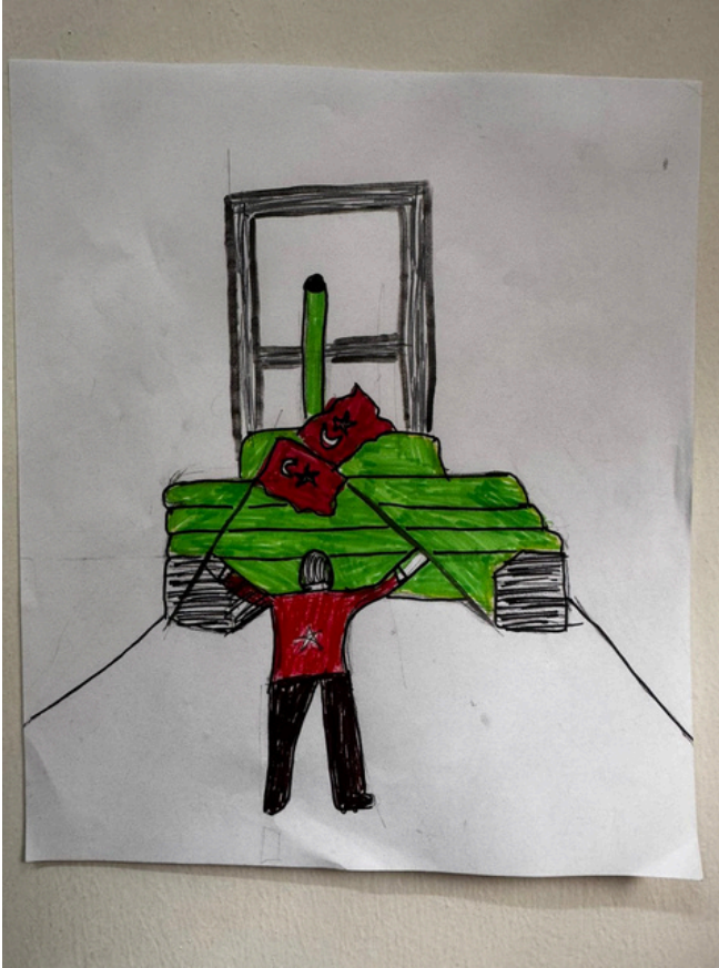
DOĞUKAN VURKIR 5-1