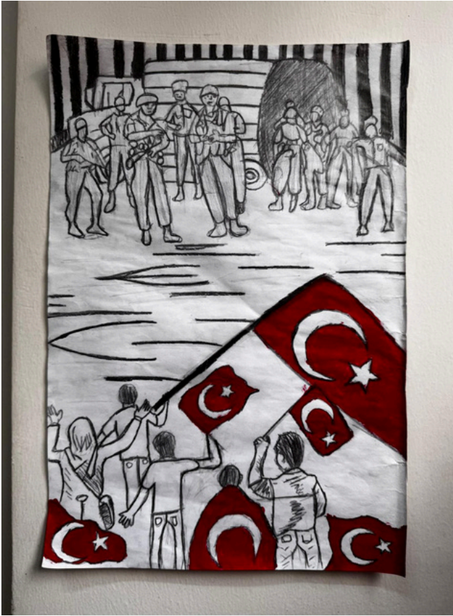
YASEMİN BACAKSIZ 8-F

Adı Türk soyadı Şehit Haine vermez geçit Ömerler çeşit çeşit Benim aziz milletim