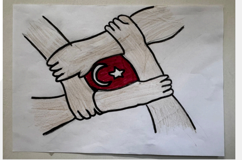
EFECAN VURKIR 5-1