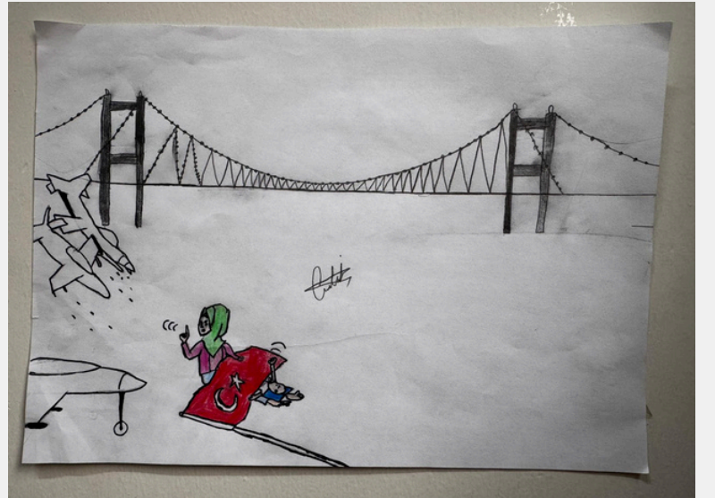
EYÜP CAN ATAŞ 5-B