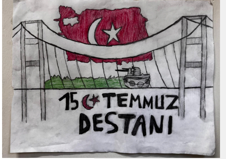
AYNUR ERGÜN 8-C