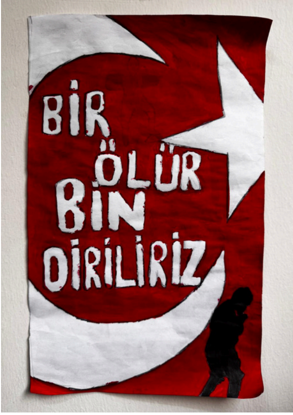
YASEMİN BACAKSIZ 8-F