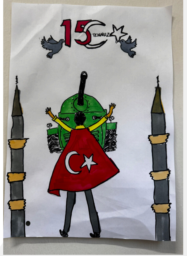
ŞEYMA ARIKAN 5-A

Ve 15 Temmuz bir zaferin adı oldu Bize karanlık bile, aydınlık yolu sundu. Ölümler, kahraman; dirilenler şehit Zafer milletin, kahramanlık milletin.